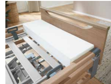
▲ Bettverlängerung und Matratzenverlängerungspolster*