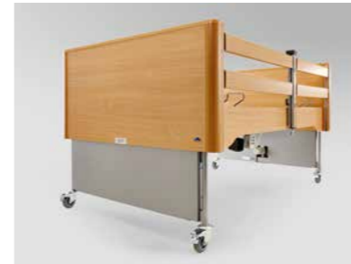
▲ KST-Verkleidung der Fahrgestelle zur dezenten Kaschierung der Technik