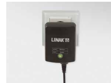
▲ Elektronisches Schaltnetzteil (Switch-Mode), direkt hinter Netzstecker integriert