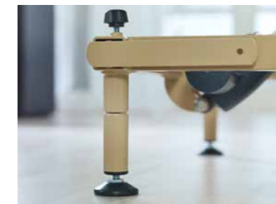
▲ Adaptierbare Standfüße zur Erhöhung der niedrigsten Position* (+7 cm)