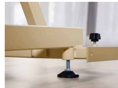
▲ Standfuß mit Bodenausgleichsschraube, Befestigungslasche