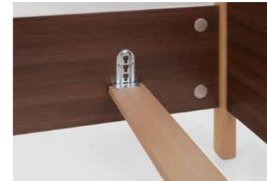
▲ Auflageleisten für Lattenrost in 4 Stufen (à 2 cm) höhenverstellbar, niedrigster Punkt 26 cm