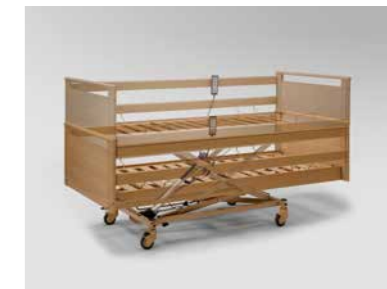
▲ Liegehöhenverstellung von 35 bis 80 cm, Verstellbereich = 45 cm