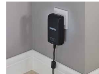
▲ Elektronisches Schaltnetzteil (Switch-Mode), direkt hinter Netzstecker integriert