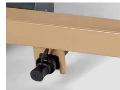
▲ Aufnahmebuchse des Steckers zur Anbindung des elektronischen Schaltnetzteils (Switch-Mode)