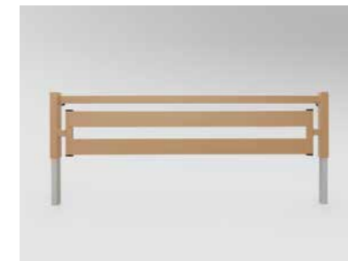
▲ Bettverlängerung mit Metallstreben, Seitensicherungen und Seitenbrettern*