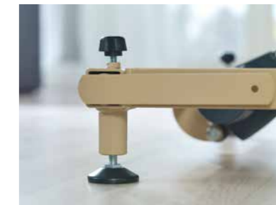
▲ Standfuß mit Bodenausgleichsschraube, Befestigungslasche