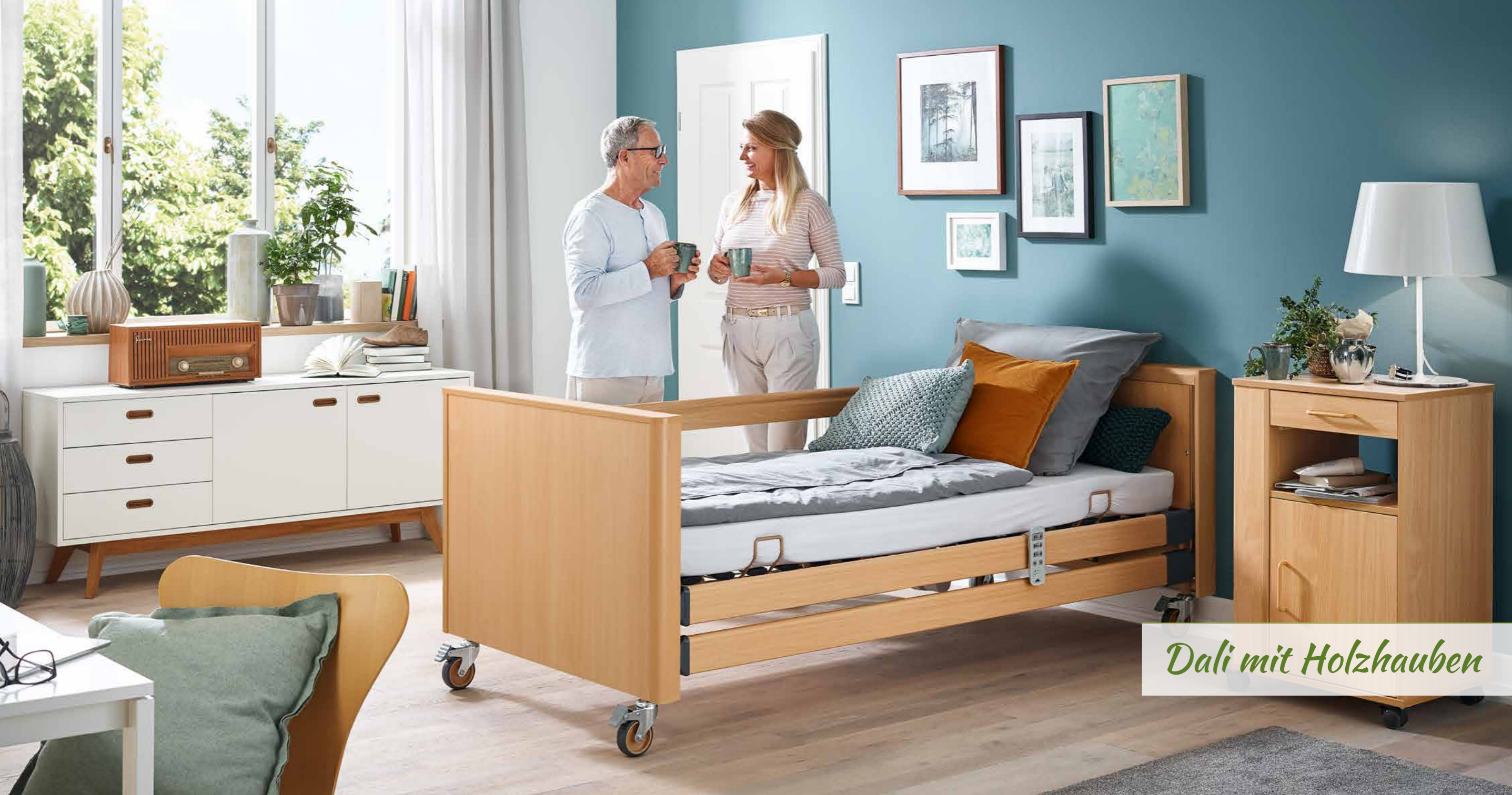
Dali mit Holzhauben