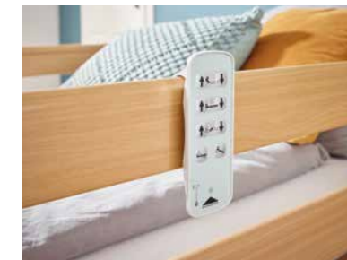
▲ Kabelloser Handschalter