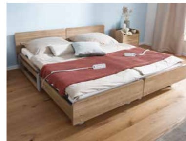
▲ Je ein Handschalter pro Liegefläche