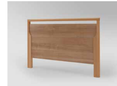
▲ Holzrahmen Buche massiv, Füllungen und Bettseiten in Kirsche Havanna