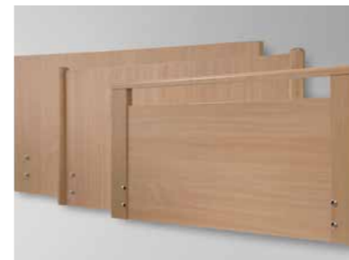
▲ Holzumbauten: Standard, Comodo mit Rundstollen*, Primero mit Griffleiste*