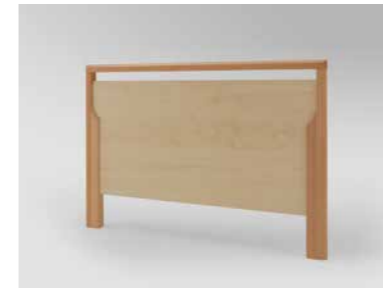
▲ Holzrahmen Buche massiv, Füllungen und Bettseiten in Königsahorn