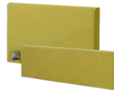
▲ Nobla kopfseitig, Nobla mala fußseitig (Holzdekor oder gepolstert)