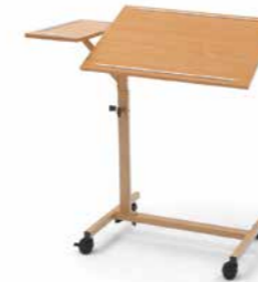
▲ Modell Duo

Höhe: 89 cm Breite: 54,5 cm Gesamttiefe: 45 cm Gesamtbreite (Bett-Tischplatte ausgeklappt): 125 cm Bett-Tischplatte von 78 - 112 cm höhenverstellbar Doppelaufrollen Ø 50 mm, 2 Rollen feststellbar