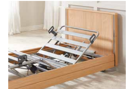
▲ Auswandernde Rückenlehne