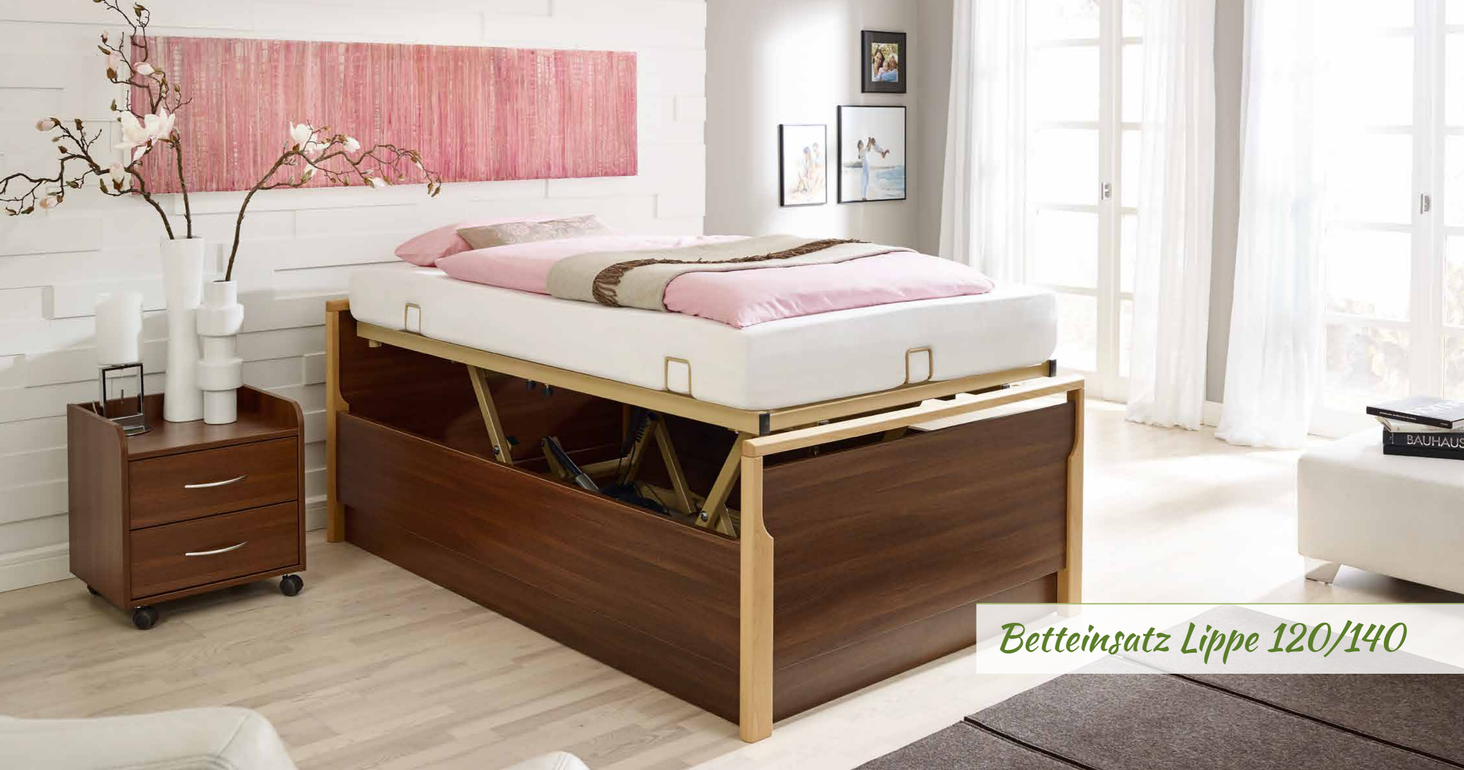
Betteinsatz Lippe 120/140