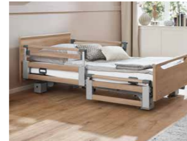
▲ Teleskopierbare Seitensicherung mit Easy-Switch-System

Liegefläche: 90 x 200 cm oder 100 x 200 cm, 4-geteilt, mit leicht zu reinigenden Metall-Lamellen; Liegehöhenverstellung von 26 – 80 cm; alle Liegeflächenelemente durch Elektromotoren verstellbar; Fußtieflage bis 15° mit automatischer Einstellung der Autokontur; Liegefläche mit auswandernder Rückenlehne nach DBfK-Empfehlung; verschiedene Häupter und Dekore wählbar