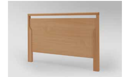
▲ Holzrahmen Buche massiv, Füllungen und Bettseiten in Buche Natur