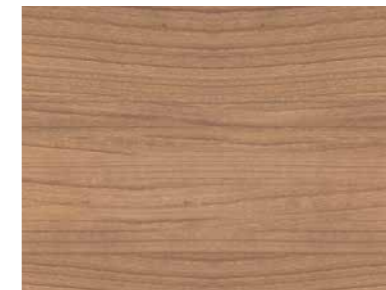
▲ Kirsche Havanna