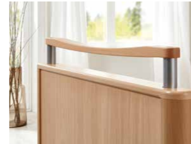
▲ Griffleiste aus Massivholz