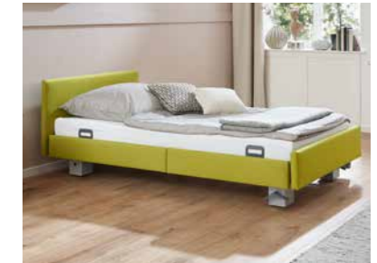
▲ Polsterung mit Stoff oder Kunstleder*