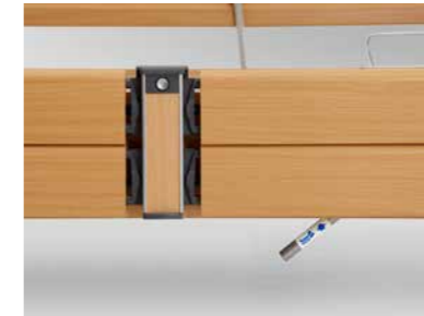
▲ Notabsenkung der Rückenlehne