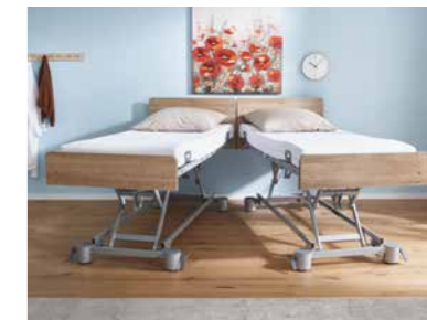
▲ Trennbare Betthälften