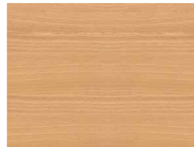
▲ Buche Natur