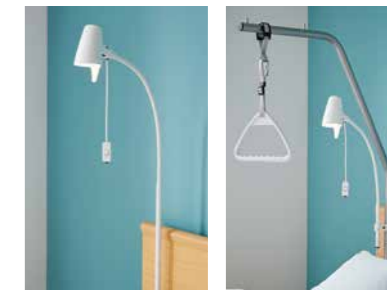
▲ Die Leselampe lässt sich am Aufrichter oder in der Aufrichtershülse anbringen