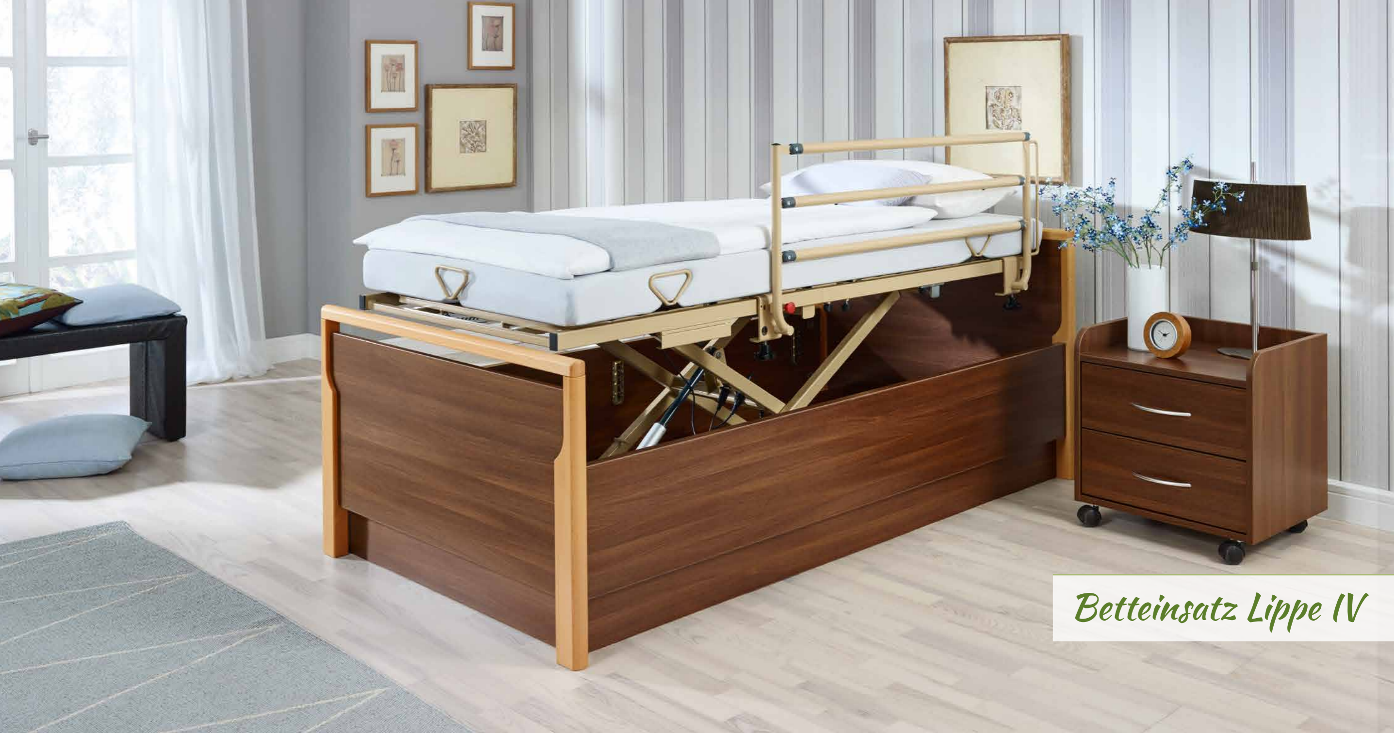
Betteinsatz Lippe IV