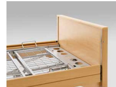
▲ Bettverlängerung inkl. längerer Seitensicherungen und Seitenbretter*