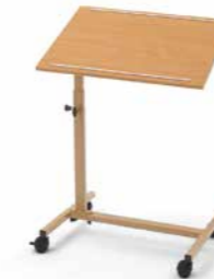
▲ Modell Solo