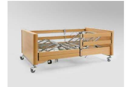
▲ Aufsteckbarer Seitensicherungs-holm*