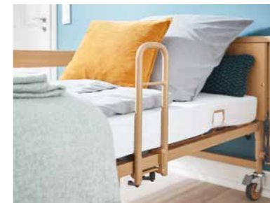
▲ Komfortable Aufstehhilfe anstelle der durchgehenden Seitensicherung*