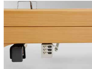
▲ Aufnahme für die Mittelstütze (links) und die Sperrbox (rechts)