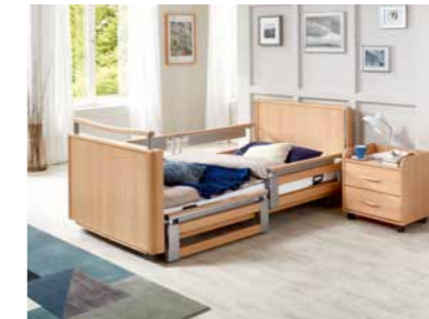
▲ Teleskopierbare Seitensicherung*