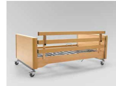
▲ Aufsteckbarer Seitensicherungs-holm*