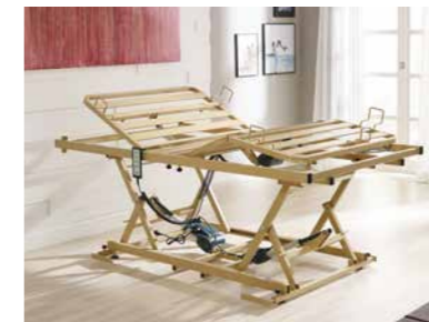
▲ Großer Höhenverstellbereich von 29 – 74 cm