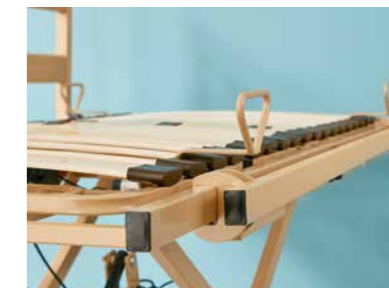
▲ Verbreiterungsschiene 5 cm*