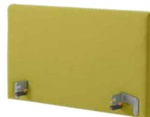
▲ Nobla (Holzdekor oder gepolstert, längere Lieferzeit)