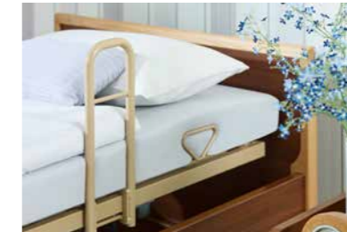
▲ Aufstehhilfe in Kombination mit einem Betteinsatz der Lippe-Serie*