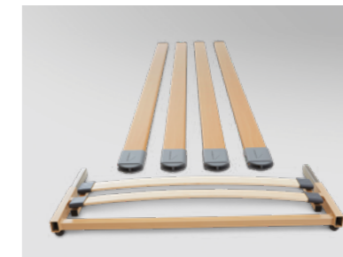
▲ Bettverlängerung inkl. Seitensicherungsholmen* (auch nachträglich montierbar)