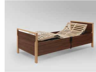
▲ Bettumbau Relax mit Motorrahmen, Rücken- und Beinlehne elektromotorisch verstellbar