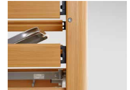
▲ Äußerst stabile Konstruktion der Seitensicherung