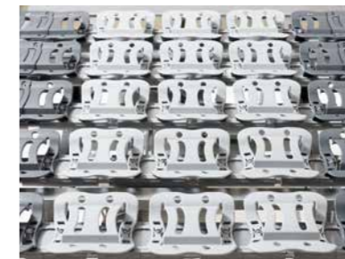
▲ Die Komfort-Liegefläche besteht aus 50 freischwingenden Feder-elementen pro Betthälfte.*