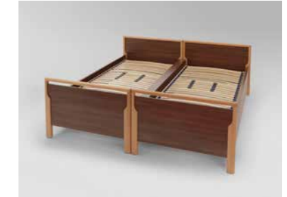
▲ 2 Bettumbauten als Doppelbett zusammengestellt, Mittelspalt durch Holzabdeckung verkleidet*