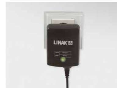
▲ Elektronisches Schaltnetzteil (Switch-Mode), direkt hinter Netzstecker integriert