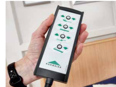
▲ Handschalter mit selektiver Sperrfunktion