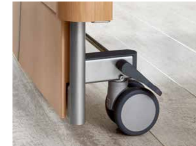
▲ Paarweise Rollenfeststellung in jeder Liegeflächenposition