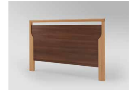
▲ Holzrahmen Buche massiv, Füllungen und Bettseiten in Bella Noce Schoko