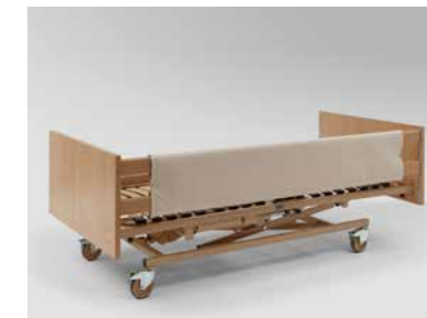
▲ Schaumlederbezug für Seitensicherungen*