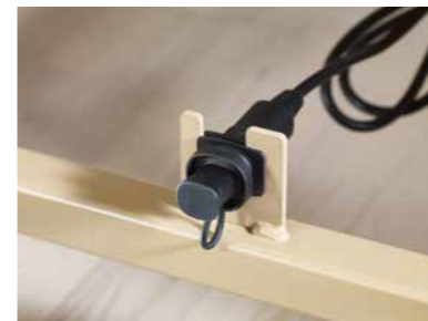
▲ Aufnahmebuchse des Steckers zur Anbindung des elektronischen Schaltnetzteils (Switch-Mode)