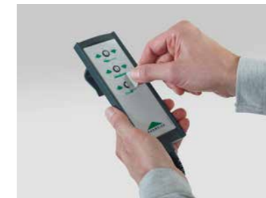
▲ Handschalter mit selektiver Sperrfunktion