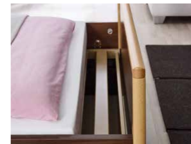
▲ Bettverlängerung* (auch nachträglich montierbar)