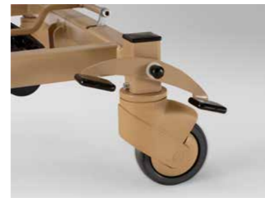
▲ Zentrale Rollenfeststellung