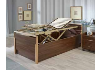
▲ Bettumbau Relax mit höhenverstellbarem Betteinsatz Lippe und bodentiefen Bettseiten, Rücken- und Beinlehne sowie Liegehöhe elektromotorisch verstellbar