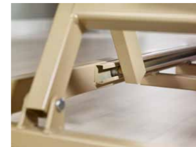
▲ Kugelgelagerte Höhenverstellung